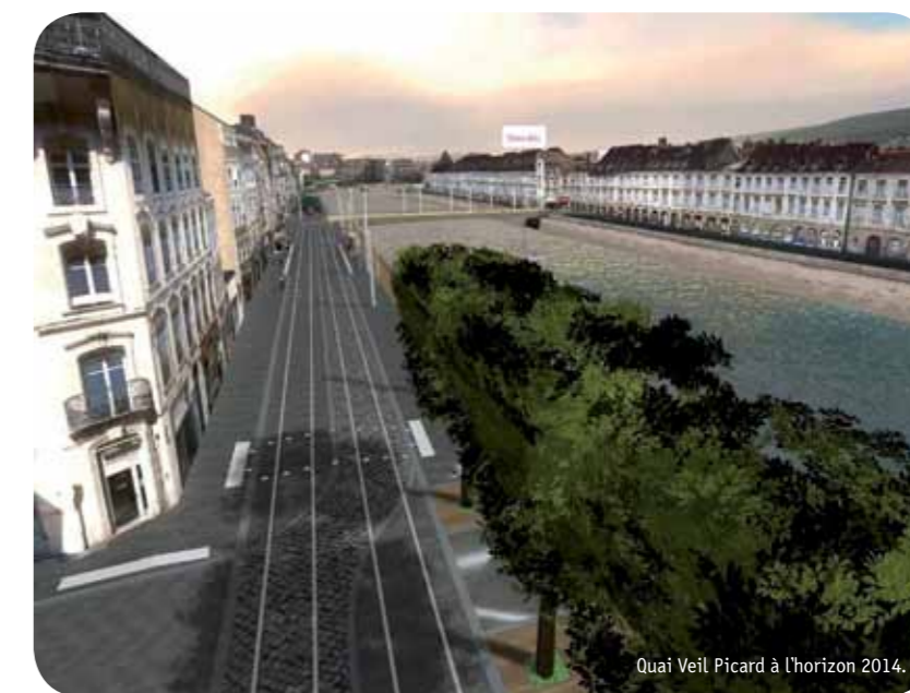
Quai Veil Picard à l'horizon 2014.

Vous trouverez dans cette lettre d'information toutes les astuces pour vos déplacements. Des médiateurs travaux et commerces sont également à votre disposition pour répondre à vos questions et trouver avec vous des solutions aux éventuels problèmes d'accès.